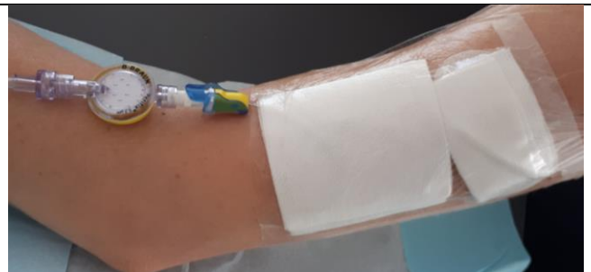
Coller le pansement adhésif transparent pour recouvrir le point d'insertion jusqu'au clip de fixation du cathéter