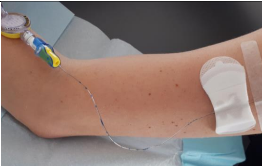
Après avoir désinfecté le point d'insertion du cathéter périnerveux en 4 temps, coller un système de fixation type GRIP LOCK®