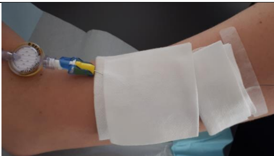
Recouvrir tout le cathéter avec une compresse stérile