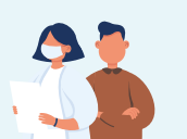
Professionnels de santé libéraux & les aidants

Elle contribue au maintien et au soutien au domicile, afin de raccourcir ou d'éviter les hospitalisations qui peuvent être des facteurs d'aggravation, ou de désadaptation sociale.